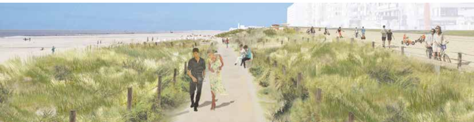
Belgium coast redevelopment

forstærkning: I Middelkerke forstærkes en eksisterende højvandsmur med et system af klitter, der skaber en naturlig habitat og forbedrer de rekreative muligheder i området. Klitterne giver også en naturlig mulighed for tilpasning, idet de kan gøres højere eller bredere i takt med havniveauets stigning.